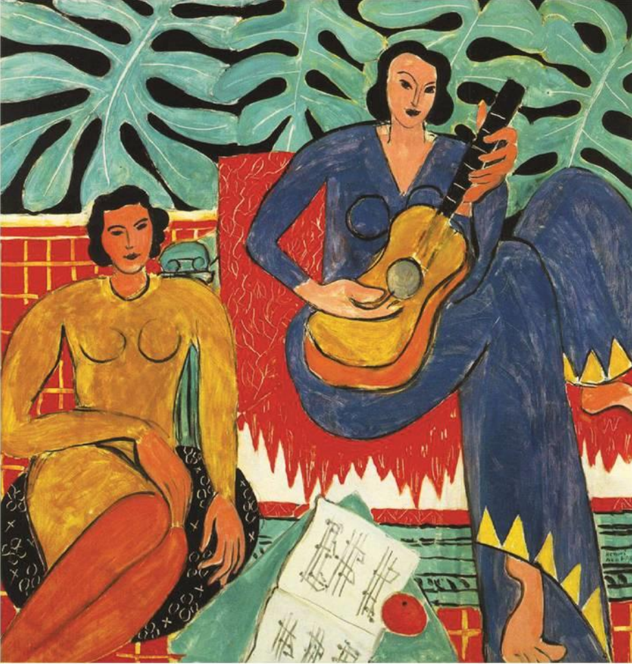
Resim: Matisse. Müzik