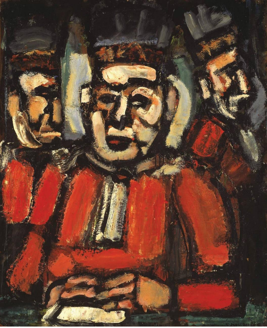
Reim: Georges Rouault. Üç yargıç

Bir motosiklet yarışısırken kendini ressam olarak yetiştiren Maurice de Vlaminck (1876-1958), akademik eğitim almamış olmasıyla övünüyor ama aynı zamanda Van Gogh'u kendisine yakın bir örnek olarak görüyordu. Paris'te etnografya ve antropoloji müzelerine gitti. Buralarda sergilenen, Afrika ve başka ülkelerden getirilmiş ilkel sanat eserlerinden etkilendi.