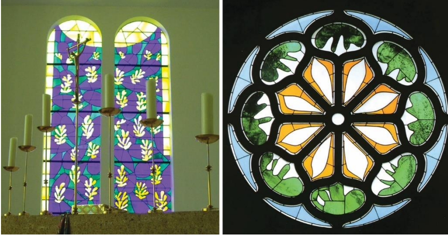
Fotoğraf: Matisse Kilisesi olarak da bilinen Notre-Dame du Rosaire’nin vitraylarından görüntüler

“Şapelde temel görevim ışık ve renklerle dolu bir zeminle karşısındaki, sadece siyah üzerine beyaz çizgilerden oluşan duvar arasında bir denge yaratmaktı. Benim için bu şapel, tamamen işime adadığım tüm hayatımın tatmini idi. Bu zor, yorucu ama dürüst bir emeğin çiçek açmasıydı.” 7