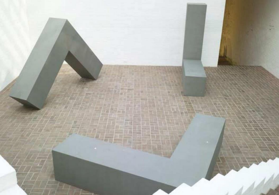
Resim: Robert Morris

Minimal sanatçıların içinde en önemlileri Carl Andre, Dan Flavin, Donald Judd, Sol LeWitt ve Robert Morris'tir.